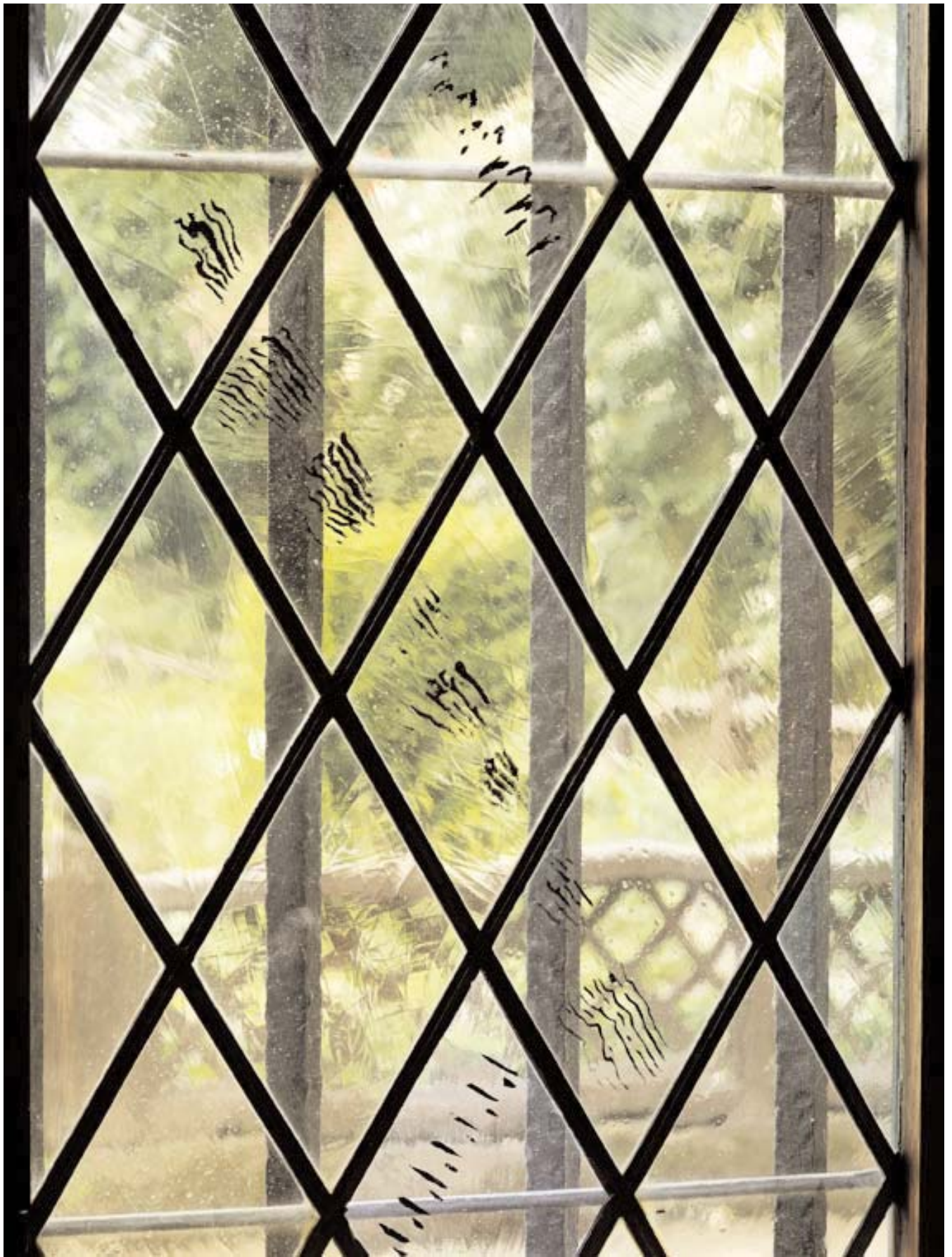
José María Sicilia, Suspendido de su canto Schilderij op 10 vensters van de Renaissancezaal Erasmushuis