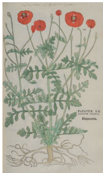
Fuchs L., De historia stirpium , KBR,VH 6393 C, f. 515, 1542

La Maison d'Érasme & le Centre National d'Histoire des Sciences