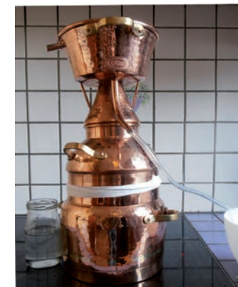
Alambic pour la distillation d'huiles essentielles